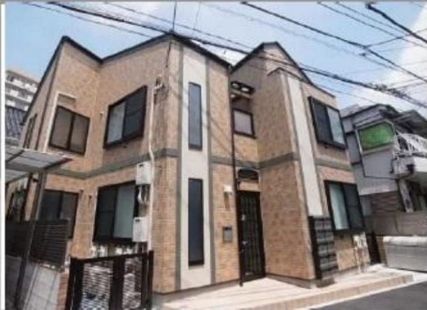
※図面と異なる場合は現況優先となります。