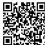
イメージ動画 (注)IoT非対応