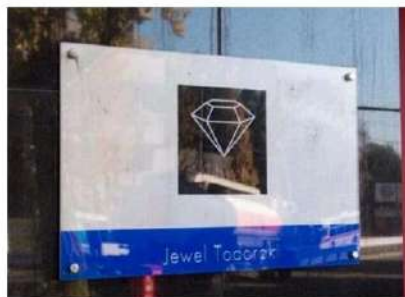
外観写真 イメージ